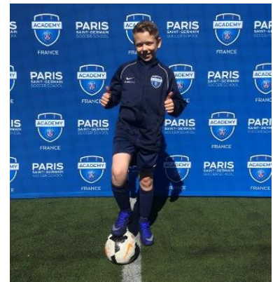
Charly, Limoges, CUP 2016